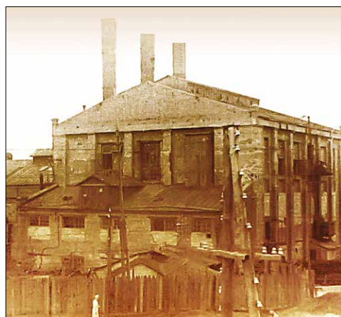
■ ВГЭС № 1 в 1932 году

Огромным испытанием для ВГЭС № 1 (в 1936 году была переименована в государственную районную электростанцию) стала Великая Отечественная война. Станция бесперебойно обеспечивала электроэнер-