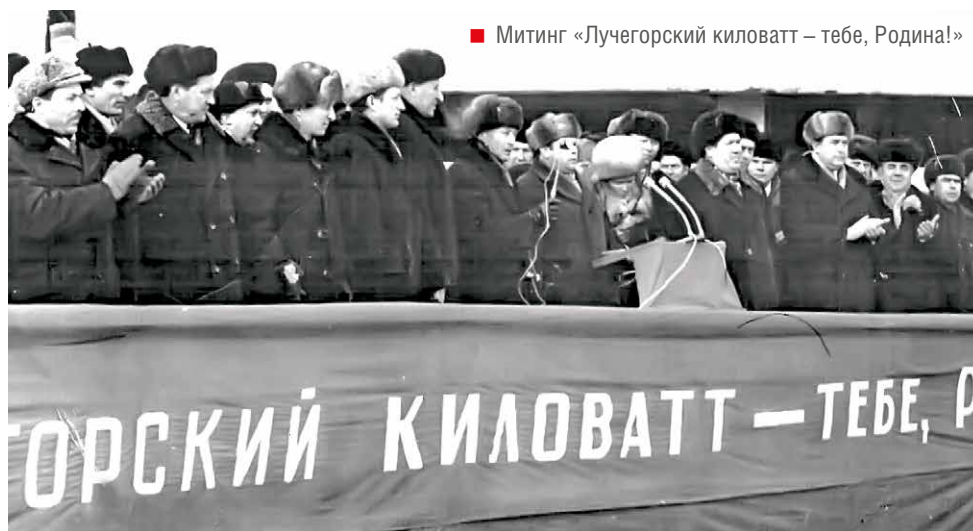
■ Митинг «Лучегорский киловатт — тебе, Родина!»

30 декабря, с окончанием ремонта энергоблока № 2, успешно завершена плановая ремонтная программа 2016 года.