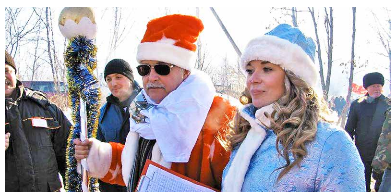
Дед Мороз и Снегурочка приступают к исполнению своих обязанностей

Необычной традиции — встретить профессиональный праздник на зимней природе, собираясь всем большим коллективом, от рабочих до руководителей, вместе с семьями, детьми, друзьями — уже более 25 лет. Название пошло от множества больших костров, которые с изобретательностью каждый год сооружаются на бивуаках цехов. Так родился конкурс костров, ставший неотъемлемой частью культурно-спортивной программы и давший имя празднику.