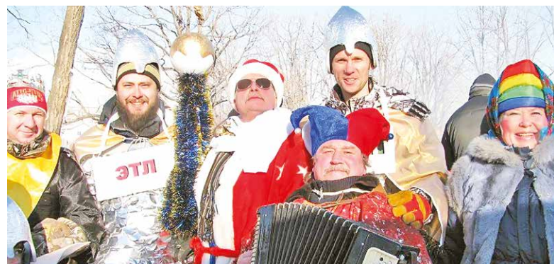
Электрический цех встречает Деда Мороза

ИНОПЛАНЕТАНЕ, цыгане, русские богатыри, царь Кощей и Баба-яга, Дед Мороз и Снегурочка, бивуаки, костры, кибитка, лошадь и огненный петух — вся эта фантазматика, словно из солнечной изморози, с утра возникла в застывшем перелеске и на льду лучегорских Чистых прудов. Это ЛуТЭК устроил праздник костров — 2016, которым по традиции отмечает День энергетика и открывает волшебную череду новогодних праздников.