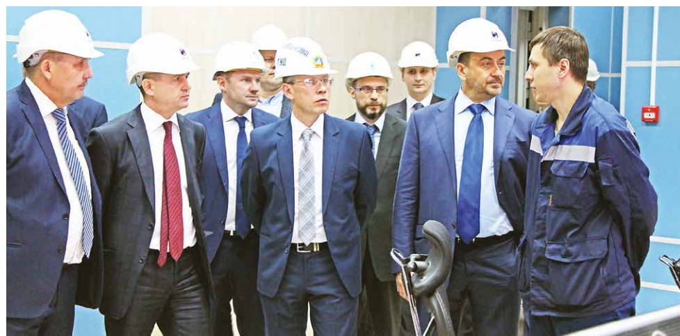
■ Высокопоставленные гости на щите управления № 3 Благовещенской ТЭЦ

Для снижения воздействия на окружающую среду на станции применены самые современные технологии. Более 98% твердых частиц золы, образующихся в процессе сгорания угля, улавливается электрофильтрами. Несмотря на увеличение электрической и тепловой мощности станции, экологическая обстановка в районе после ввода второй очереди ТЭЦ не изменилась.