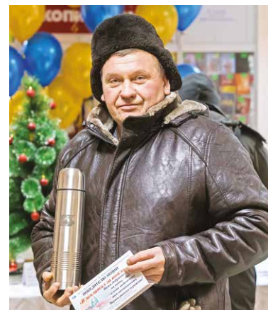
■ Победитель акции в номинации «Добросовестный плательщик»

Акция «Я заплатил за тепло» проводится филиалом «Нерюнгринская ГРЭС» АО «ДГК» второй год подряд.