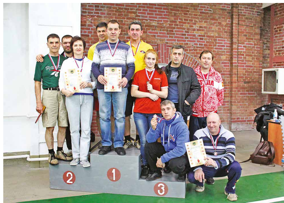
■ Команды-победительницы в турнире по теннису