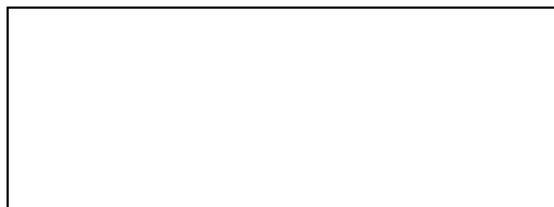
Схема границы эксплуатационной ответственности

е) Локальные очистные сооружения на объекте _____ (есть/нет).