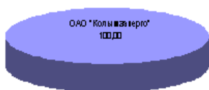
Структура акционерного капитала ОАО "Дальневосточная генерирующая компания" на 31.12.2006 года на 01.04.2007 года

Акции ОАО «ДГК», размещенные при учреждении компании ОАО «Колымаэнерго», в результате исполнения договора займа между ОАО «Колымаэнерго» и ОАО «Хабаровскэнерго» стали собственностью последнего, а затем, в результате реорганизации ОАО «Хабаровскэнерго», перешли в собственность его правопреемника – ОАО «ДЭК».