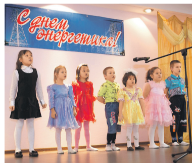
Концерт для энергетиков

церт, а заканчивалась встреча по традиции сладким чаепитием. Впрочем, расставались взрослые и дети ненадолго: и в последние дни уходящего года, и в дни новогодних каникул неугомонные волонтеры станции приезжали в гости в детдом, где совместно с детьми соорудили ледяную горку, играли в мафию, пили чай, общались, отдавая часть своей энергии и души новым друзьям. Станут ли они в будущем энергетиками, сегодня неизвестно, но надеемся, что благодаря в том числе и усилиям волонтеров-энергетиков они станут хорошими людьми.