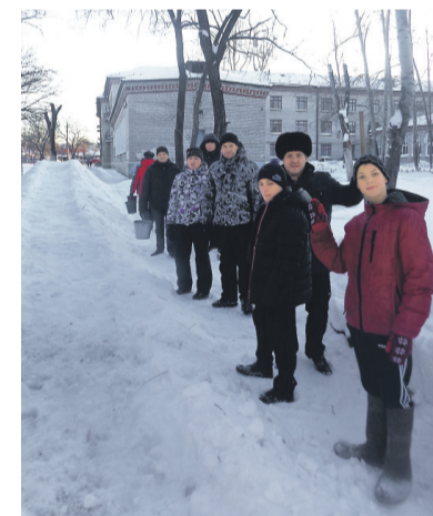
Строим горку вместе: сотрудники ХТЭЦ-1 в детдоме №5