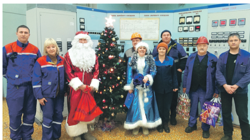
Дед Мороз и Снегурочка на ХТЭЦ-1

В аппарате управления филиала «Хабаровская генерация» в преддверии праздника профсоюзные активисты также нарядились