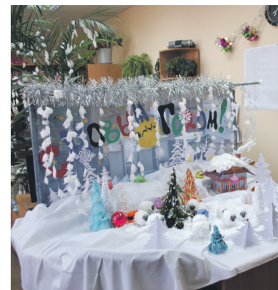
Один из лучших новогодних кабинетов — кабинет ПТО филиала