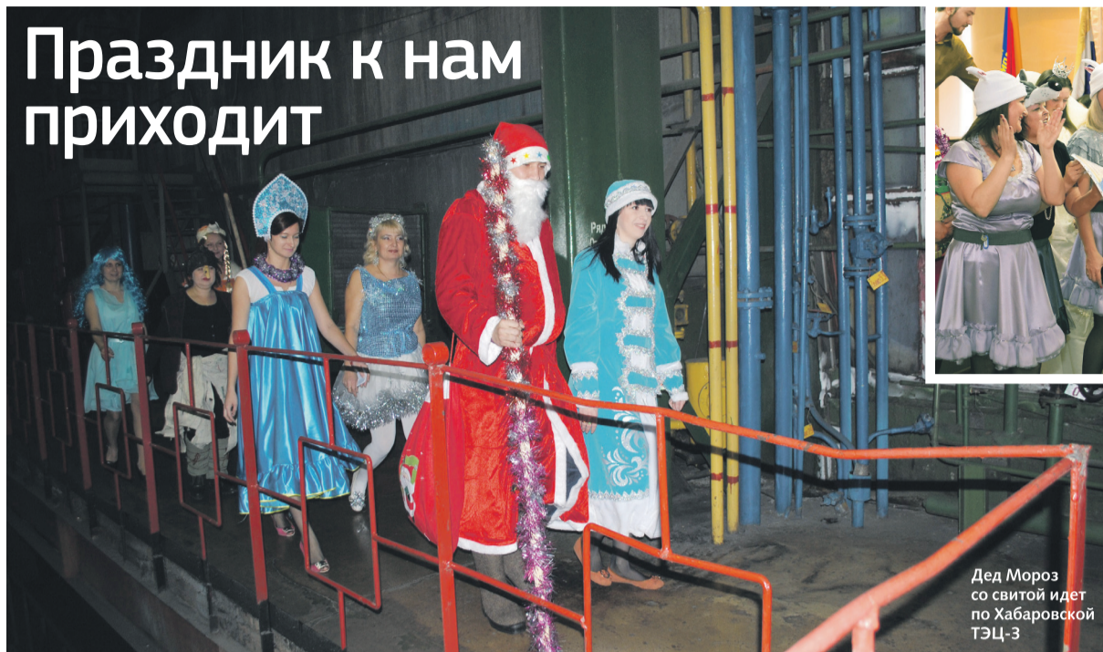
Дед Мороз со свитой идет по Хабаровской ТЭЦ-3

Предпраздничные дни для энергетиков — самая горячая рабочая пора. Однако работники «Хабаровской генерации» чудесным образом сумели выкроить время на новогодние сюрпризы.