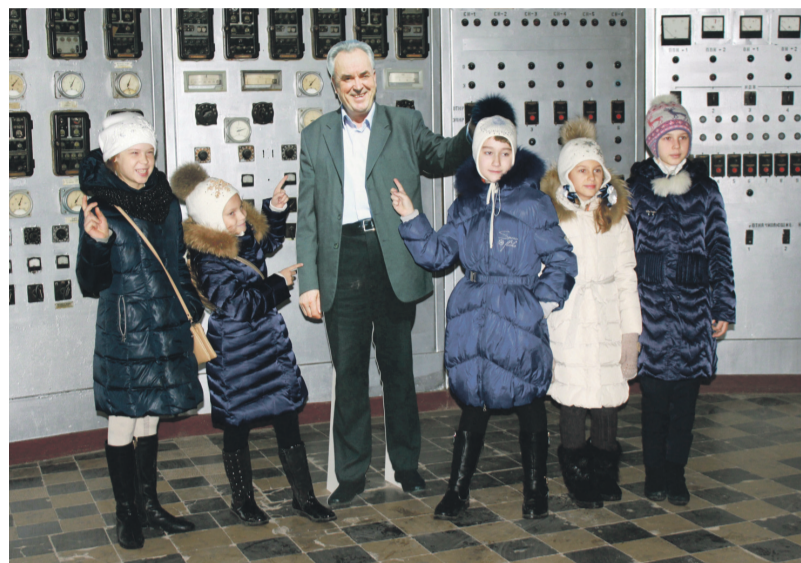
Школьники с удовольствием фотографировались на фоне экспонатов музея

рые, затаив дыхание, наблюдали за «волшебством» ведущей, добывающей энергию, к примеру, из обычного яблока. И как тут не поверить в чудо под названием «электростатическая левитация», когда созданная по законам науки волшебная палочка в твоих руках невидимой силой заряженных частиц поднимает в воздух предметы? Кстати, школьники недолго оставались простыми зрителями шоу. Под хохот и восторженные возгласы они участвовали в экспериментах в одиночку и группами, стараясь вскипятить теплом своих рук жидкость в колбе или поджечь мыльные пузыри. В конце урока детишек ждал самый вкусный эксперимент, в результате которого каждый из них получил сладкую вату.