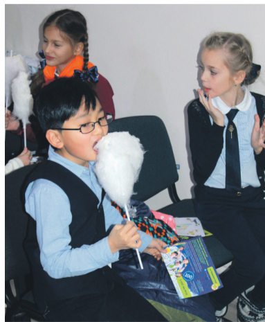
Результатом самого «вкусного» эксперимента стала сладкая вата

«Дети с огромным интересом следили за всеми экспериментами. Очень здорово, что им предоставили возможность не только посмотреть, но и самим поучаствовать в создании этих «чудес»