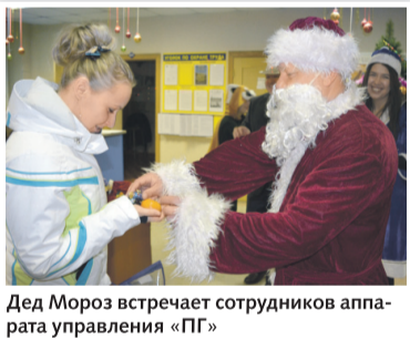
Дед Мороз встречает сотрудников аппарата управления «ПГ»

Утро 30 декабря для сотрудников филиала «Приморская Генерация» выдалось по-настоящему праздничным. На входе всех работников аппарата управления встречали Дед Мороз и Снегурочка, которые провели новогоднюю беспроигрышную лотерею. Но чтобы получить подарок, сотрудникам нужно было рассказать стихотворение, спеть песню или станцевать.