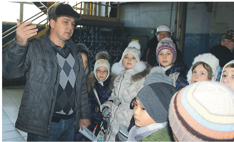
Ребятам провели мини-экскурсию по Владивостокской ТЭЦ-1