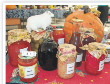
Разнообразие выбора кулинарного конкурса