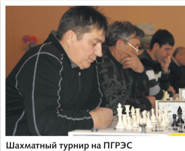
Шахматный турнир на ПГРЭС

На Партизанской ГРЭС был организован шахматно-теннисный турнир, в котором приняли участие более 30 энергетиков, а также состоялся нешуточный частушечный бой. За победу боролись команды всех цехов и восемь подразделений станции. Задорный конкурс частушек проводился впервые и был воспринят сотрудниками на ура, поэтому планируется, что теперь он станет традиционным.