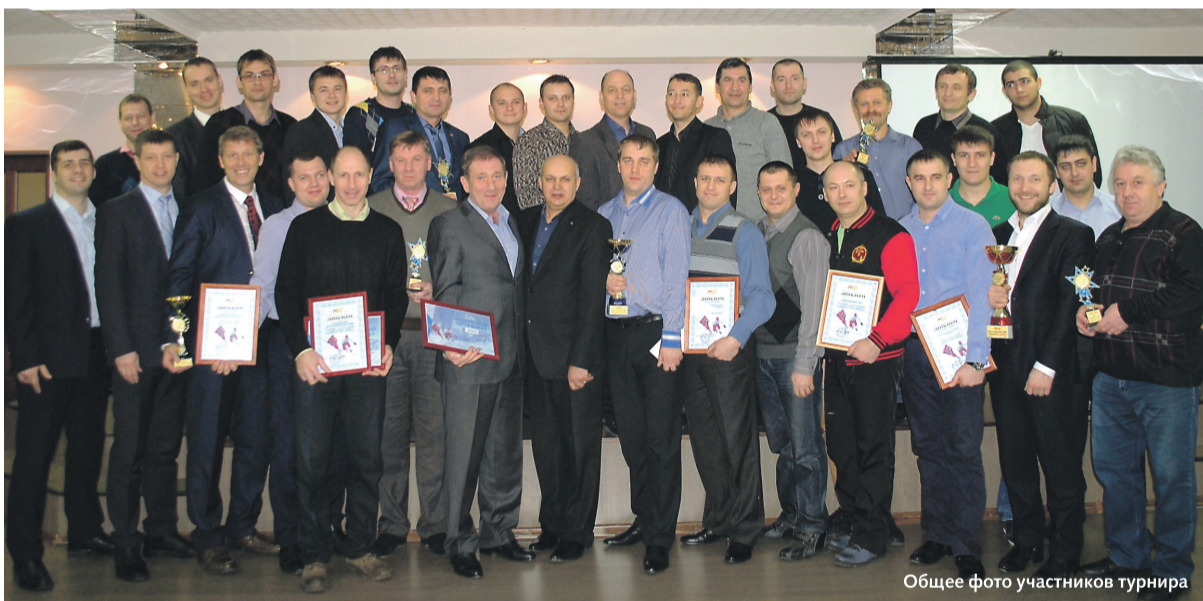
Общее фото участников турнира

Команда исполнительного аппарата ОАО «ДГК» стала победителем ежегодного турнира по мини-хоккею с мячом, завершившегося в Хабаровске. Пятый по счету чемпионат принес немало сюрпризов спортсменам и их болельщикам.