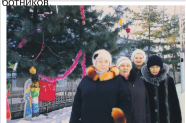
Елка в Артеме

Активно прошли праздники и на Артемовской ТЭЦ. Дед Мороз заглянул в гости к работникам станции 31 декабря. Он вручил сладкие подарки тем, кто оставался работать в ночную смену, чтобы они тоже смогли отметить праздник пусть не бокалом шампанского, а кружкой чая и вкусным пирожным. Сотрудники топливно-транспортного цеха нарядили елку, которая растет на улице возле здания ТТЦ. Зеленая красавица уже дотянулась до второго этажа, поэтому, чтобы ее украсить, пришлось вызывать специальный подъемник. Каждый год энергетики делают подарки любимой ели: покупают электрические гирлянды, вырезают и раскрашивают пенопластовые фигурки Деда Мороза и Снегурочки, а новогодние украшения — снежинки и шары — делают дети и внуки работников.