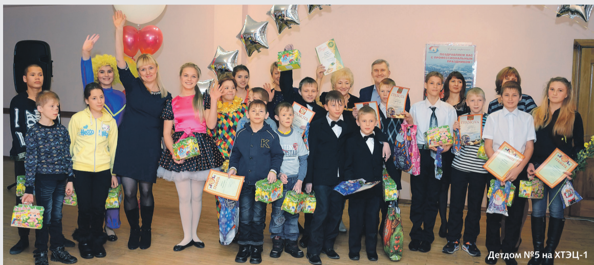
Детдом №5 на ХТЭЦ-1