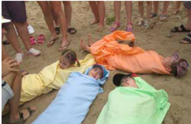
ПЕЛЕНАТЬ МЛАДЕНЦЕВ НУЖНО НЕ ТОЛЬКО БЫСТРО, НО И КРАСИВО!

На уроке правописания тоже пришлось помучиться, потому что