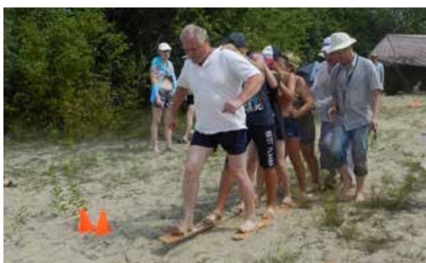
САМЫЕ ДРУЖНЫЕ ДОЕХАЛИ ДО ФИНИША БЫСТРЕЕ ВСЕХ!

диктант здесь предлагалось писать ногой. «Мама мыла раму» — выводит «ученик», зажав фломастер между пальцев. Может, и не слишком ровно получилось, но, главное, понятно!