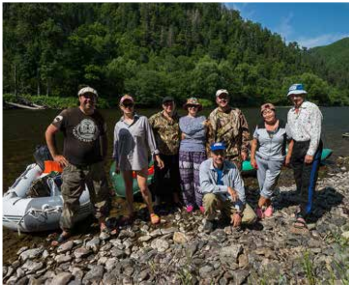
СПУСК ПО ГОРНОЙ РЕКЕ, РЫБАЛКА И ПЕНИЕ У КОСТРА — ЧТО МОЖЕТ БЫТЬ ЛУЧШЕ? ЭНЕРГЕТИКИ ХТЭЦ-1 ОТВЕТСТВЕННО ЗАЯВЛЯЮТ — ВЫХОДНЫЕ УДАЛИСЬ!

Но с опытными рыбаками сплавляться оказалось совсем не страшно,