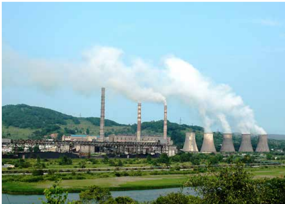
АРТЕМОВСКАЯ ТЭЦ — «СЕРДЦЕ» РАЙОНА. ВПЛОТЬ ДО НАЧАЛА 70-х ГОДОВ ОНА ОСТАВАЛАСЬ САМОЙ КРУПНОЙ ЭЛЕКТРОСТАНЦИЕЙ ПРИМОРЬЯ.

4 НАСЕЛЕННЫХ ПУНКТА: ГОРОД АРТЕМ, ПОСЕЛКИ АРТЕМОВСКИЙ, ЗАВОДСКОЙ И СУРАЖЕВКА