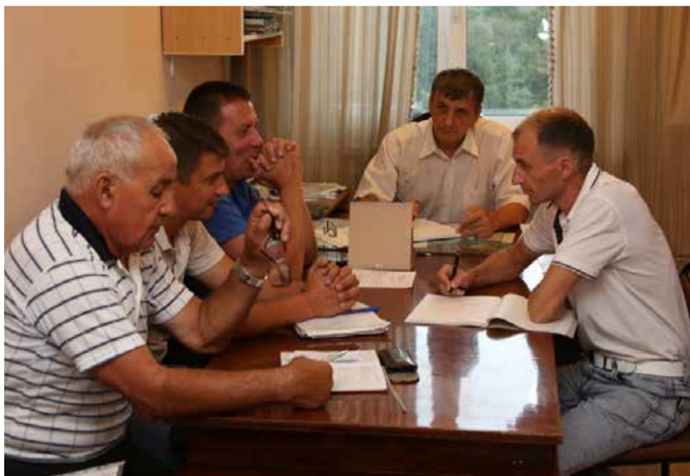
ЭНЕРГЕТИКИ УВЕРЕНЫ: ДРУЖНЫМ, СЛАЖЕННЫМ КОЛЛЕКТИВОМ, С 40-ЛЕТНИМ ОПЫТОМ ЗА ПЛЕЧАМИ, ОНИ СПРАВЯТСЯ С ЛЮБЫМИ ЗАДАЧАМИ!