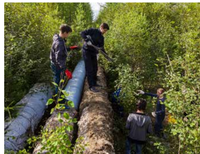
ШКОЛЬНИКИ ОЧЕНЬ РАДЫ, ЧТО ПЕРВОЙ ОТМЕТКОЙ В ИХ ТРУДОВОЙ КНИЖКЕ БУДЕТ ФИЛИАЛ «НЕРЮНГРИНСКАЯ ГРЭС» АО «ДГК»

ЭНЕРГЕТИКИ филиала «Нерюнгринская ГРЭС» очень ответственно подходят к вопросу профориентационной деятельности среди студентов и школьников разных возрастов. Эта работа включает помощь подшефным детским садам, лекционные занятия в школах и вузах, организацию экскурсий на станцию и, конечно же, летнее трудоустройство школьников и прохождения производственной практики студентов.