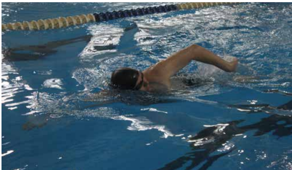
ЛЕТНЯЯ СПАРТАКИАДА ПРИМОРСКОЙ ГЕНЕРАЦИИ ВКЛЮЧИЛА В СЕБЯ СОРЕВНОВАНИЯ ПО ТАКИМ ДИСЦИПЛИНАМ, КАК ПЛАВАНИЕ, СТРИТБОЛ И БОУЛИНГ