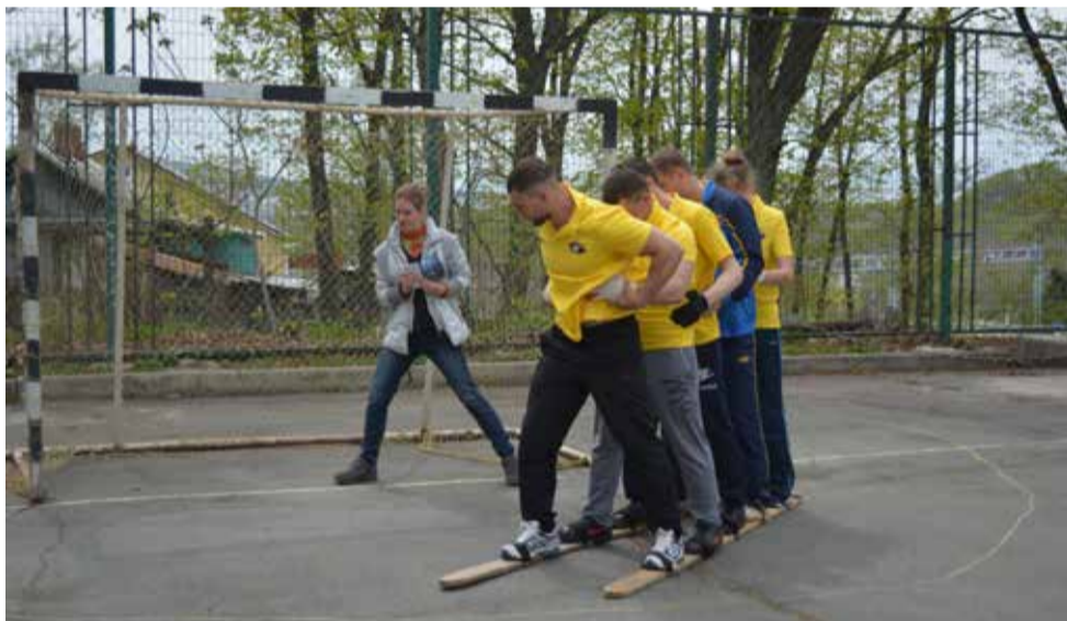
УЧАСТНИКАМ МОЛОДЕЖНОГО ФОРУМА ПРИШЛОСЬ ПРОЙТИ НЕПРОСТОЙ СПОРТИВНЫЙ КВЕСТ, СОСТОЯЩИЙ ИЗ ЗАДАНИЙ НА ВЫНОСЛИВОСТЬ И КОМАНДООБРАЗОВАНИЕ