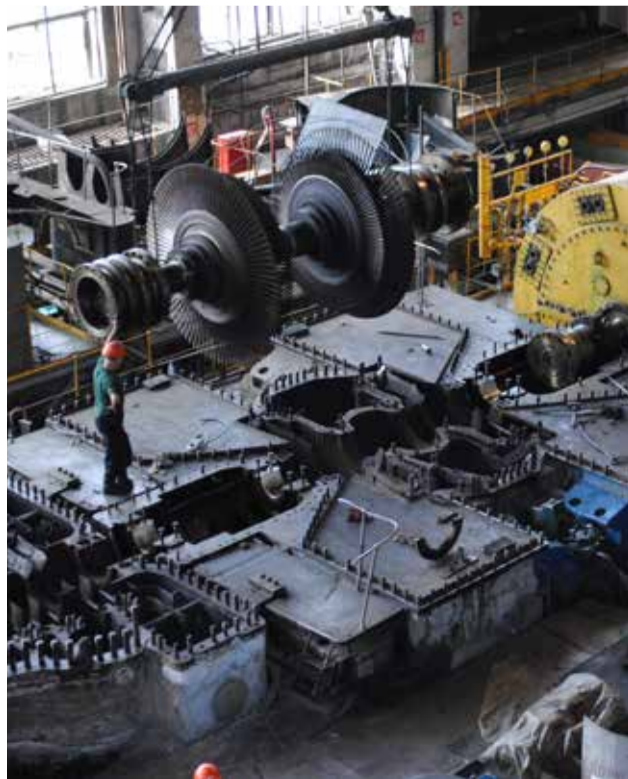
В АВГУСТЕ И СЕНТЯБРЕ НА ХТЭЦ ЕДИНОВРЕМЕННО БУДУТ ПРИВОДИТЬСЯ В ПОРЯДОК СРАЗУ 7 ЕДИНИЦ ОСНОВНОГО ОБОРУДОВАНИЯ, ИЗ НИХ 4 ОБЪЕКТА РЕМОНТИРУЮТСЯ КАПИТАЛЬНО

По данным экологической службы Хабаровской генерации, перевод первых семи котлоагрегатов станции на газовое топливо привел к суммарному снижению выбросов загрязняющих веществ в атмосферу на 5 000 тонн. Ожидается, что газификация еще одного котлоагрегата добавит к этой цифре 900 тонн.