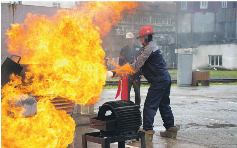
Пожарный этап соревнований