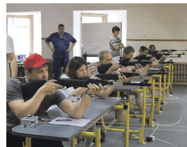
Команда «ДГК» сдает нормы по стрельбе из пневматической винтовки