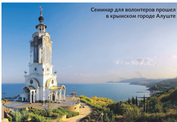
Семинар для волонтеров прошел в крымском городе Алуште