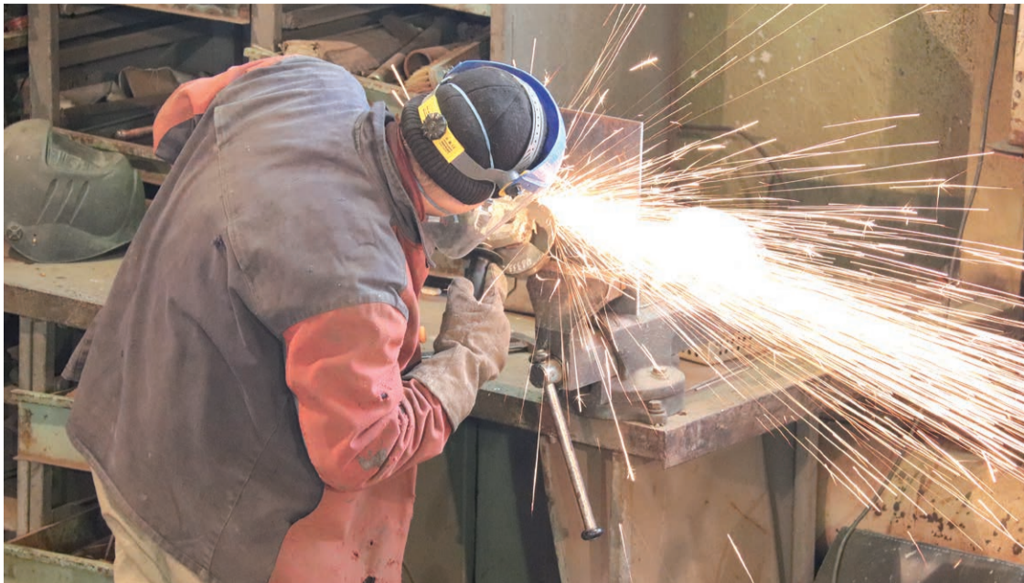
Практическая часть конкурса