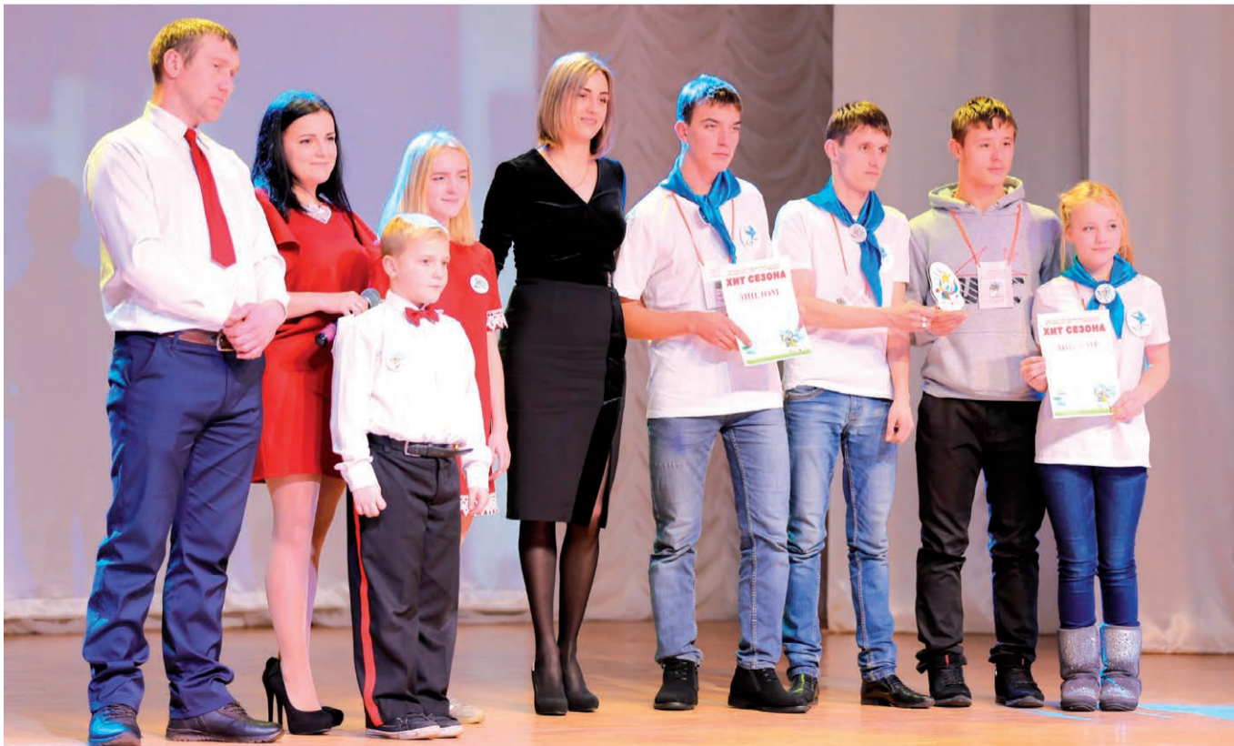
Волонтеры Амурской ТЭЦ и их подшефные заняли 1 место в Амурском фестивале детского и молодежного кино и телевидения «Хит сезона».

– Хочу пожелать нашим волонтерам оставаться такими же активными, чуткими и открытыми, нести тепло своих сердец тем, кто в этом нуждается, делиться знаниями и опытом. Помогать людям – это одно из самых важных и самых почетных призываний, которое может быть у человека.