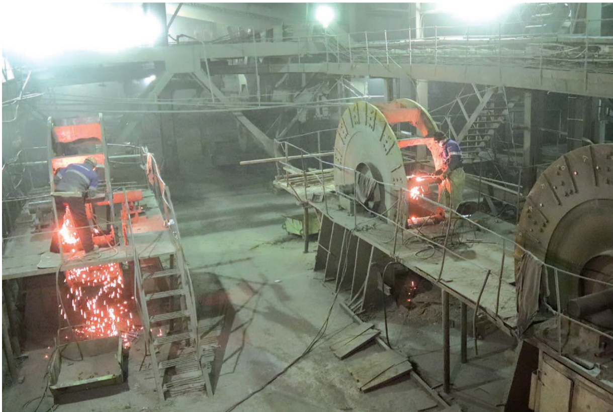
Ремонтная кампания основного оборудования Приморской ГРЭС завершается

Специалисты ЦЦР выполняют ремонт насосного оборудования, запорной арматуры, котлоочистные работы, металлоремонт, ремонт изо-