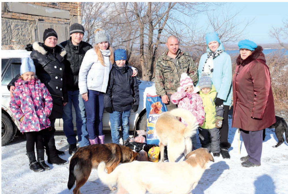
Волонтеры ЛуТЭКа вместе с детьми навели порядок в приюте для собак

«В начале года мы утвердили план работы, в который вошло 15 мероприятий, среди них как сложные, требующие большой подготовки, так и простые, например оказать помощь в сопровождении воспитанников Светлогорского детского дома на какие-либо мероприятия, проводимые другими организациями и учреждениями», – поясняет куратор волонтерского движения, ведущий специалист группы социально-трудовых отношений отдела управления пер-