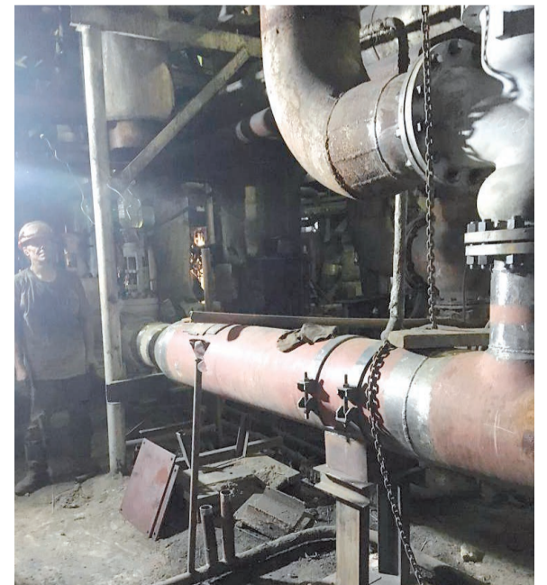
РОУ на БирТЭЦ

«Редукционно-охлаждающие установки на ТЭЦ эксплуатируются с 1973 года. В настоящее время изменились нормативные требования к установкам высокого давления, существующее оборудование морально и физически устарело. На основании экспертиз про-