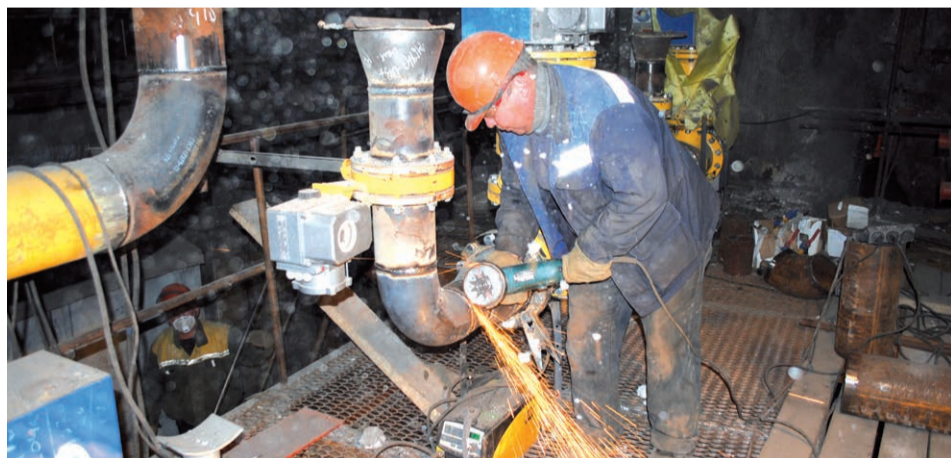
Идет реконструкция угольного котлоагрегата № 8 по переводу на газовое топливо

ЭТО ДЕВЯТЫЙ ПО СЧЕТУ КОТЕЛ СТАНЦИИ, КОТОРЫЙ ПЕРЕВЕДУТ НА ГАЗОВОЕ ТОПЛИВО