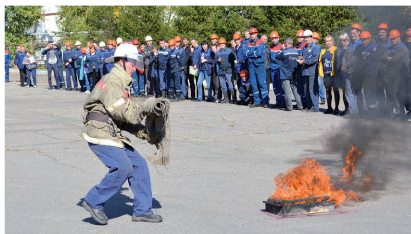
В смотре-конкурсе на лучшее противопожарное состояние Хабаровская генерация обошла соперников по таким показателям, как усиление противопожарного режима, обучение персонала и его подготовка к действиям в случае возникновения нештатных ситуаций и другим